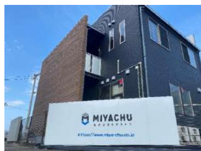
写真：仙台空港工場（岩沼市）