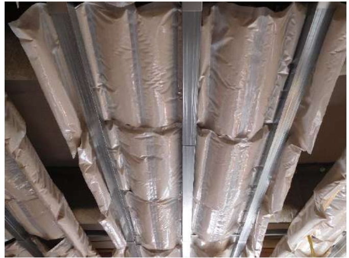
写真：天井制振材採用実績

「天井制振材」は、上下階の騒音問題に対して、振動エネルギーを制振することで低減して対策する製品です。子どもの飛び跳ねる音や歩行音などの「ドスン」と下の階に伝わる鋭くて低い音や、スプーンなどを床に落としたときのような「コツン」といった軽めで高い音など、幅広い生活に伴う騒音に高い効果を発揮します。様々な二重天井に適用可能で、天井裏に隙間なく敷き詰めるだけと施工も簡単、騒音に困る下の階から工事が完了できることで、リニューアル工事にも最適です。