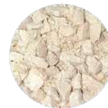
写真：（上）特殊区画袋