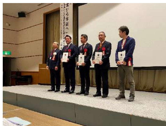
写真：認定企業の記念撮影

また、本製品は令和5年11月29日に公益財団法人七十七ニュービジネス振興財団が主催する「七十七ニュービジネス助成金」の対象となったことも付け加えさせていただく。